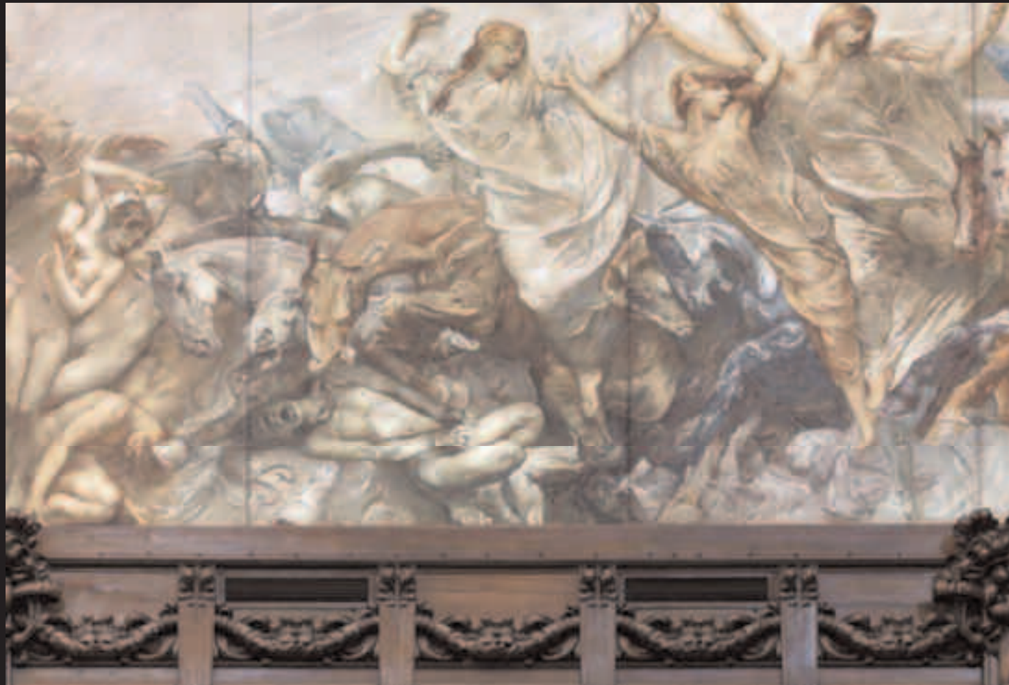
I CAVALLI DEI LIBERATORI CALPESTANO LA DISCORDIA DAL CAPO AVVOLTO DAI SERPENTI, PARTICOLARE DEL FREGIO DELL'AULA DIPINTO DA GIULIO ARISTIDE SARTORIO.