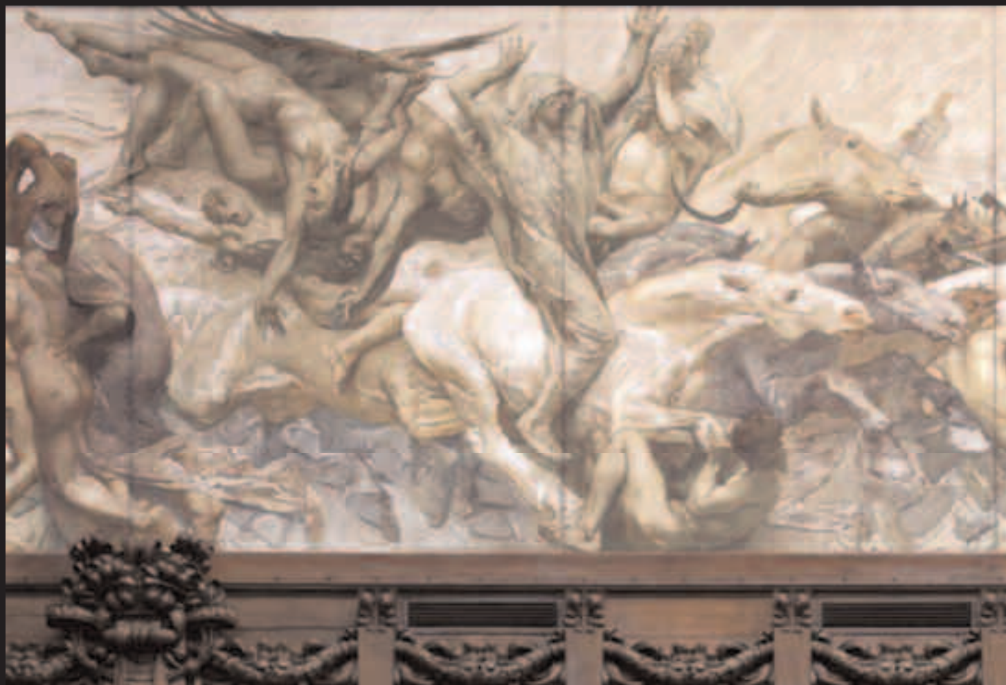
L'EROISMO COMUNALE RESPINGE I BARBARI, PARTICOLARE DEL FREGIO DELL'AULA DIPINTO DA GIULIO ARISTIDE SARTORIO.