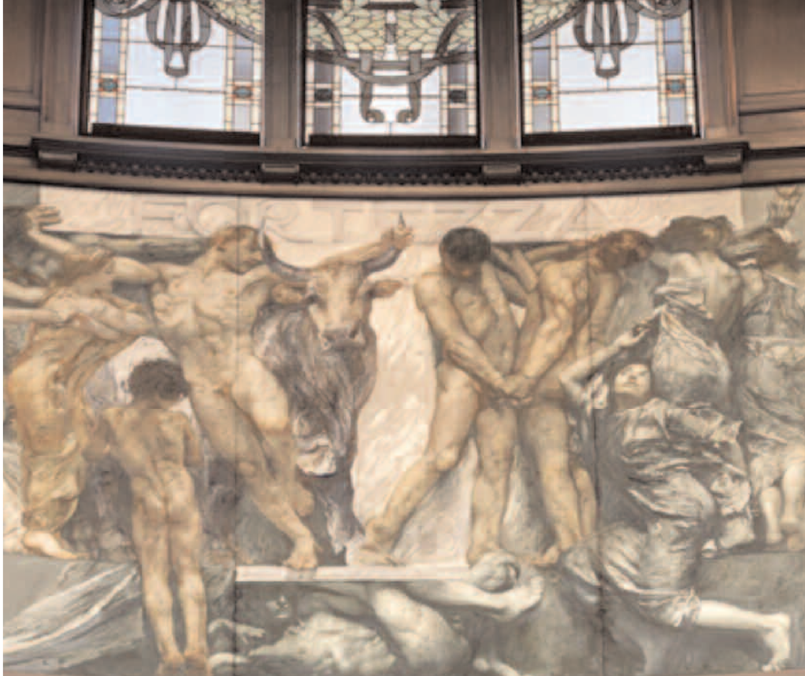
LA FORTEZZA, PARTICOLARE DEL FREGIO DELL'AULA DIPINTO DA GIULIO ARISTIDE SARTORIO.