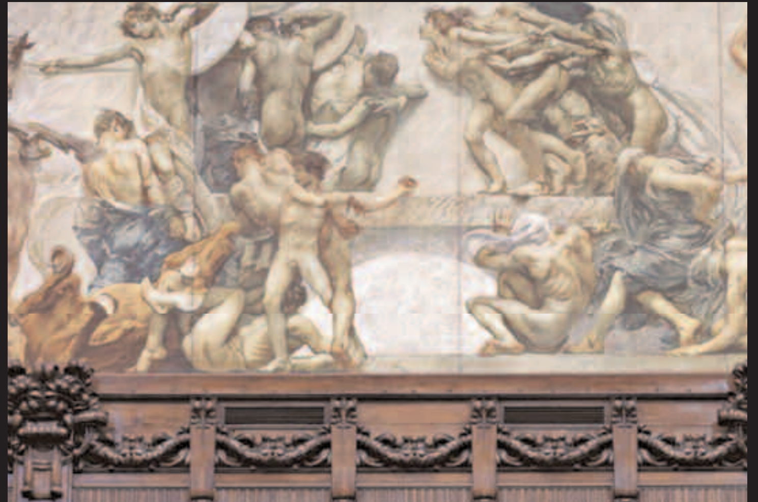
L'ARA ITALICA, PARTICOLARE DEL FREGIO DELL'AULA DIPINTO DA GIULIO ARISTIDE SARTORIO.

ALLE PAGINE 112-113 GLI ITALIANI CHE ARRESTANO I CAVALLI DEGLI INVASORI, PARTICOLARE DEL FREGIO DELL'AULA DIPINTO DA GIULIO ARISTIDE SARTORIO.