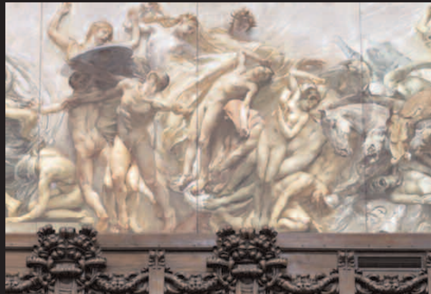
IL RISORGIMENTO, PARTICOLARE DEL FREGIO DELL'AULA DIPINTO DA GIULIO ARISTIDE SARTORIO.