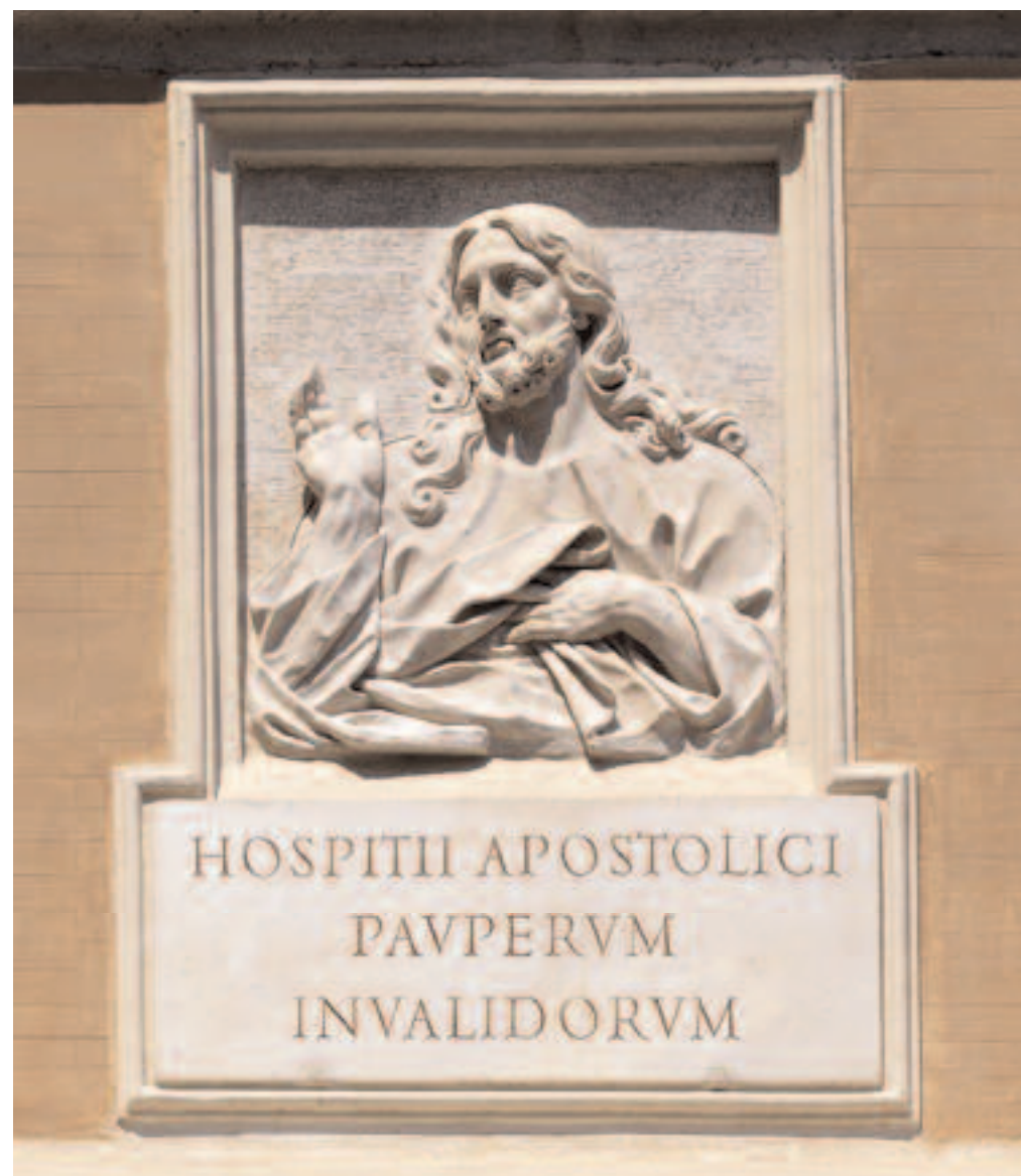
PARTICOLARE DEL BASSORILIEVO COLLOCATO SUL LATO SINISTRO DELLA FACCIATA, CHE INDICAVA LA DONAZIONE PONTIFICIA DEL PALAZZO MONTECITORIO ALL'OSPIZIO APOSTOLICO DE' POVERI INVALIDI, SANCITA DALL'ATTO DEL CHIROGRAFO DI INNOCENZO XII IL 19 DICEMBRE 1696.

PARTICOLARE DEL BASSORILIEVO SIMMETRICAMENTE COLLOCATO SUL LATO DESTRO DELLA FACCIATA.