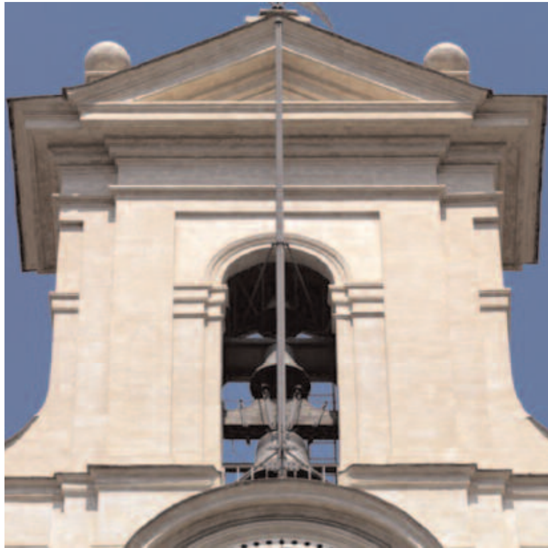
PARTICOLARE DELLA VELA CAMPANARIA. PARTICOLARE DELL'OBELISCO PSAMMETICO.