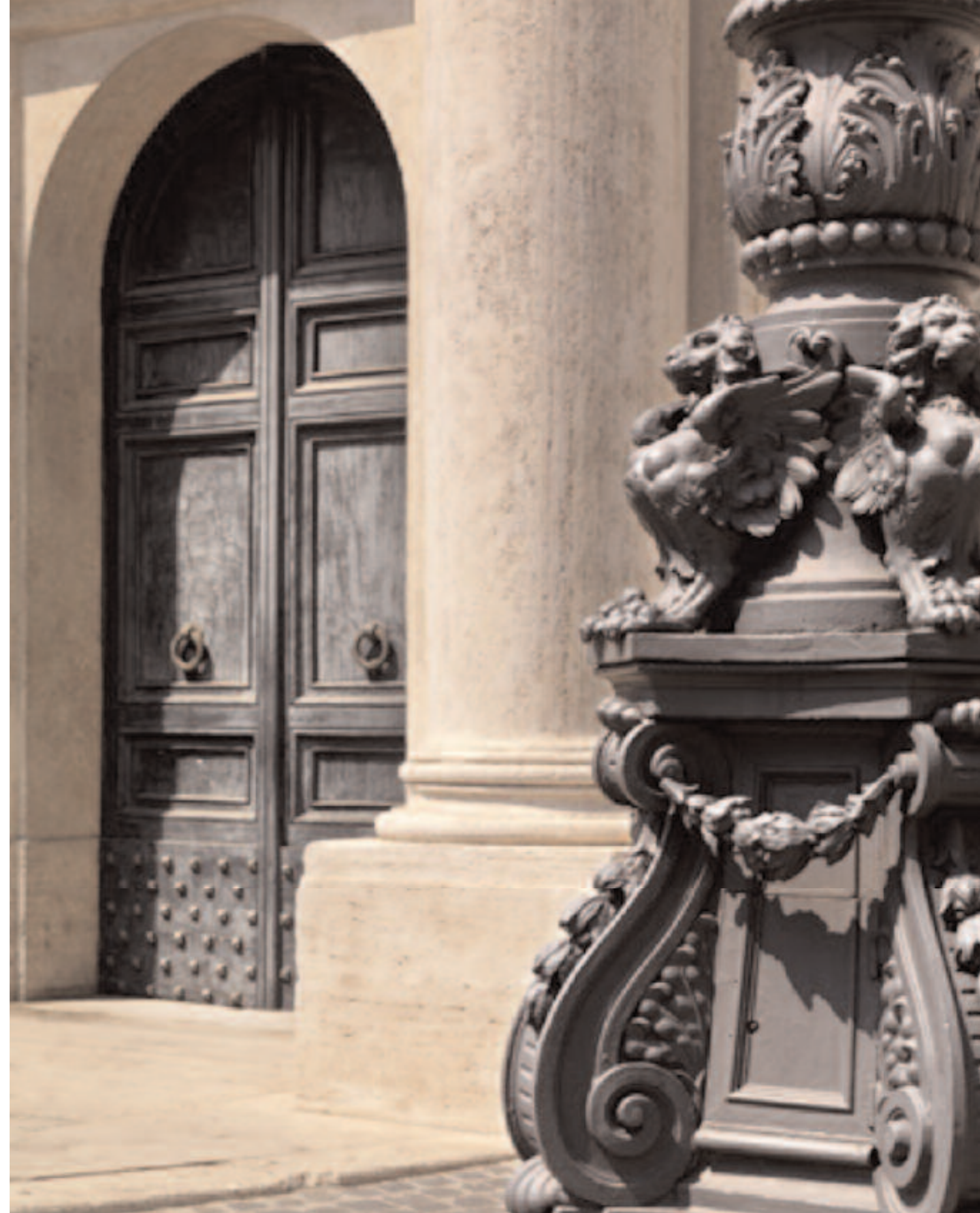
PARTICOLARE DI UNO DEI DUE PORTONCINI LATERALI DELL'INGRESSO PRINCIPALE.