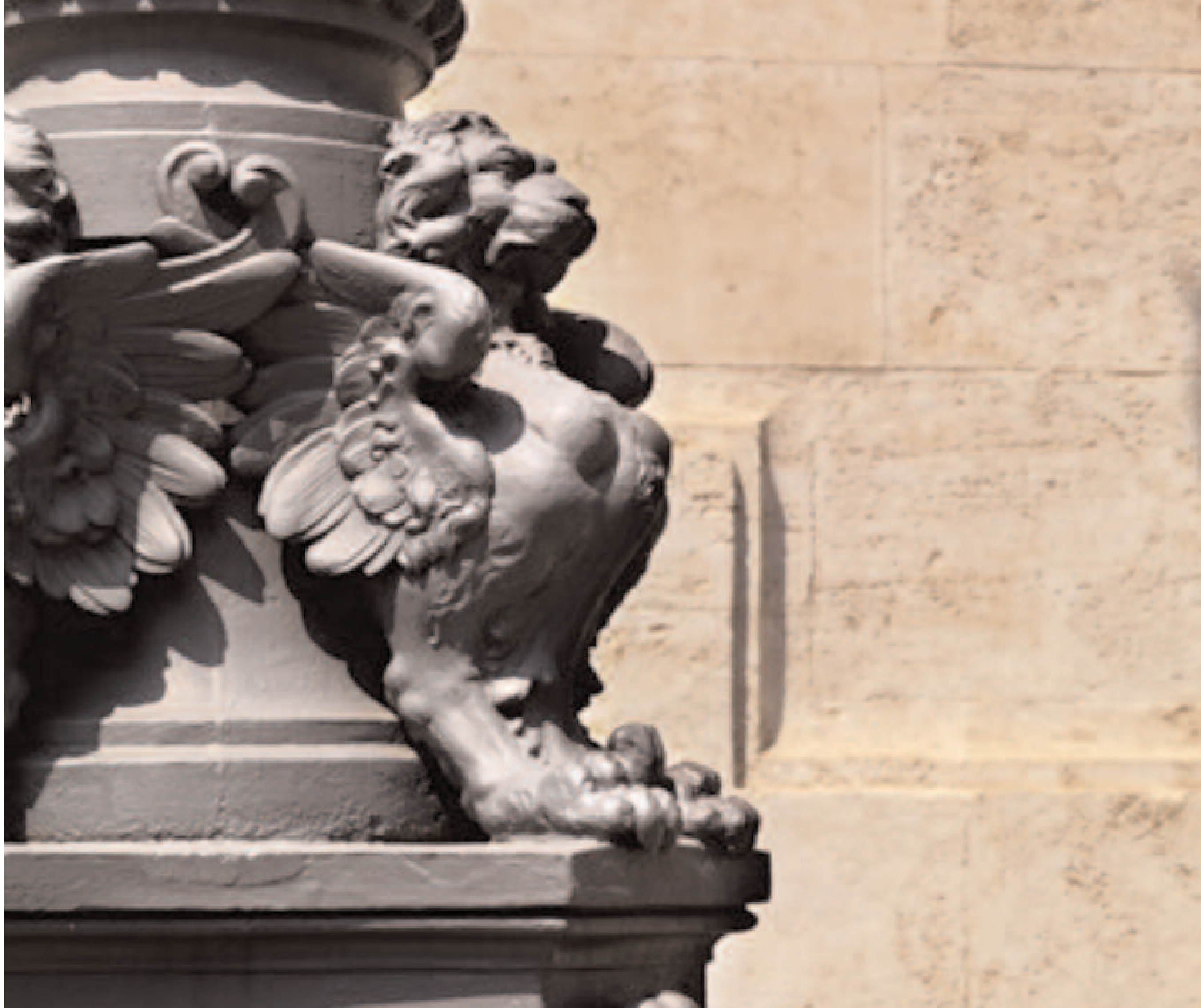
PARTICOLARE DEL LAMPIONE DI FRONTE ALL'INGRESSO PRINCIPALE.